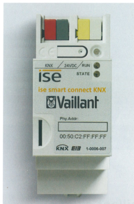
Obr. 4 - Komunikační rozhraní ise smart connect KNX Vaillant

Z výše uvedených skutečností vyplývá, že společnost Vaillant Group dbá zejména o systémové řešení pro vytápění a ventilaci v budovách. Toto řešení je optimalizováno tak, že vlastní instalace, uvedení do provozu a následné užívání zajistí všem zákazníkům, od instalační firmy přes servisního technika až po koncového uživatele, ty nejlepší podmínky při jejich činnostech. ■