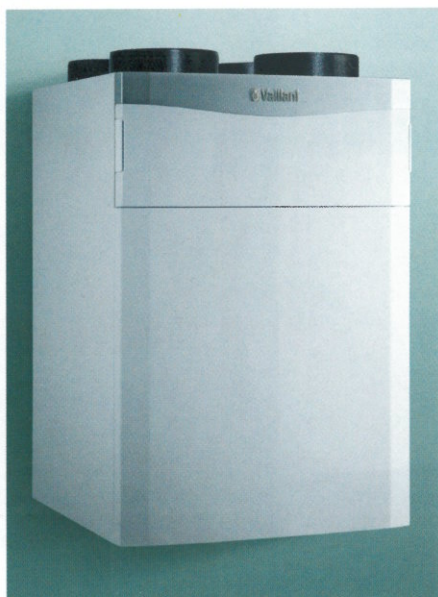
Obr. 1 - recoVAIR 260/4 a 360/4