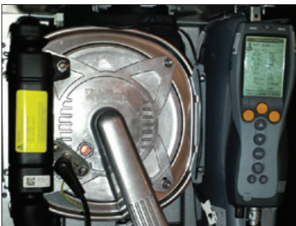
Obr. 4 Měření hodnot NOx ve spalinách a plynové nastavení