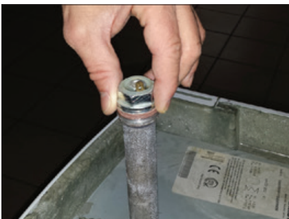
Obr. 7 Kontrola ochranné ochranné tyče v zásobníku teplé vody