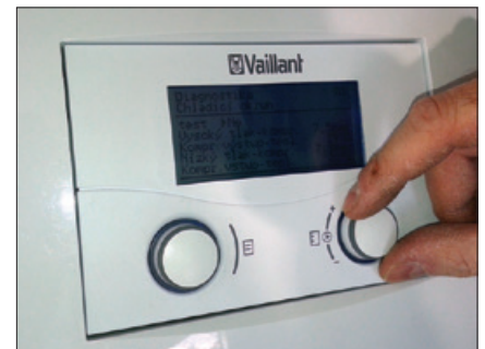
Obr. 9 Kontrola nastavení regulace