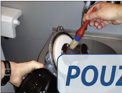
Obr. 1 Čištění hořáku spalovací komory