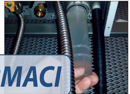
Obr. 3 Kontrola odvodu kondenzátu a čištění sifónu