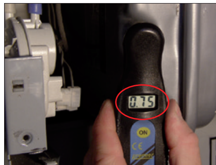
Obr. 5 Kontrola tlaku expanzní nádoby (požadovaná hodnota tlaku)