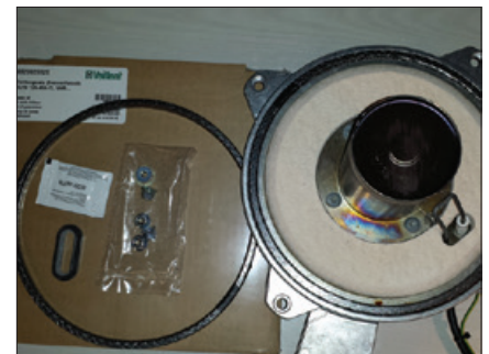
Obr. 6 Výměna těsnění spalovací komory s použitím originálního náhradního dílu